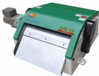
〔FINE MAG UK〕

マグネット配列の最適化によりマグネットドラム表面磁束密度 9000 ガウスの超高磁力を実現した「FINEMAG UK シリーズ」は従来回収困難であった磁化されにくいスラッジや微細スラッジの回収に効果的です。超硬工具加工で発生するスラッジを効率良く回収、高い脱水性能で回収した超硬スラッジはリサイクル資源としての価値が向上。また、フィルタ装置（珪藻土フィルタ/ラインフィルタ/ペーパーフィルタ等）と組合せることでフィルタ負荷を軽減し、ランニングコスト抑制にも貢献します。貸出機による性能評価も可能ですので、是非ご検討ください。