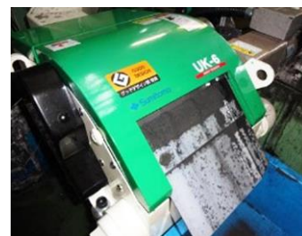
〔超硬スラッジ回収状況〕