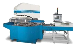
AC 2000-F with loading table

[公益社団法人 砥粒加工学会 次世代固定砥粒加工プロセス専門委員会 第 100 回記念研究会]