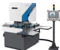
AC 700-F with loading table

という点が挙げられます。また、オプションとして AC マシンに加工したいワークピースを装填する自動搬送装置とのセットでの販売も行っております。